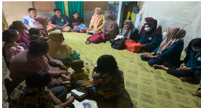
Gambar 1. Penyampaian materi

Pengabdian masyarakat dalam bentuk penyuluhan mencuci tangan dilaksanakan sesuai dengan tahapan yang telah direncanakan, pelaksanaan kegiatan dihadiri oleh 15 peserta, terdiri dari kader posyandu, posbindu, dan jamaah pengajian di wilayah puskesmas Banjarsari tentang upaya meningkatkan dukungan keluarga terhadap pencegahan penyakit covid-19. Pelaksanaan penyampaian materi konsep dan simulasi serta demonstrasi mencuci tangan merupakan langkah awal dalam upaya mencegah resiko penularan virus corona yang dapat menyerang melalui kontak tangan, badan, droplet/ udara.